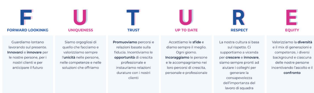
Figura 1- Employee Value Proposition

I principali valori di riferimento del Gruppo Links sono: